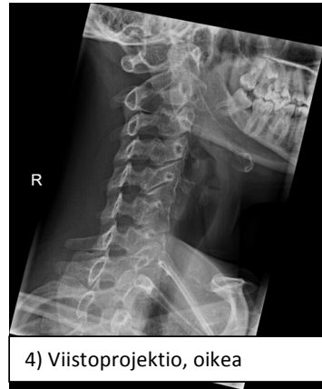
4) Viistoprojektio, oikea